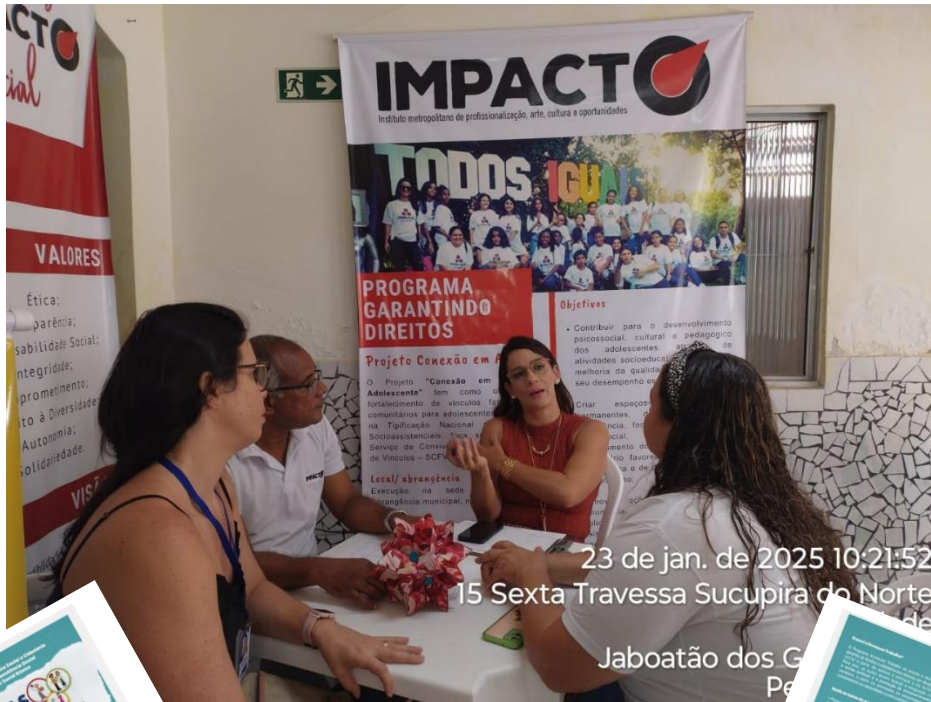
23 de jan. de 2025 10:21:52 15 Sexta Travessa Sucupira do Norte Jaboatão dos G P