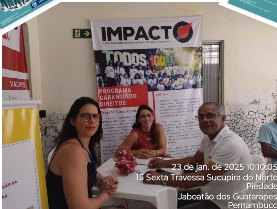
23 de jan. de 2025 10:10:05 15 Sexta Travessa Sucupira do Norte Piedade Jaboatão dos Guararapes Pernambuco